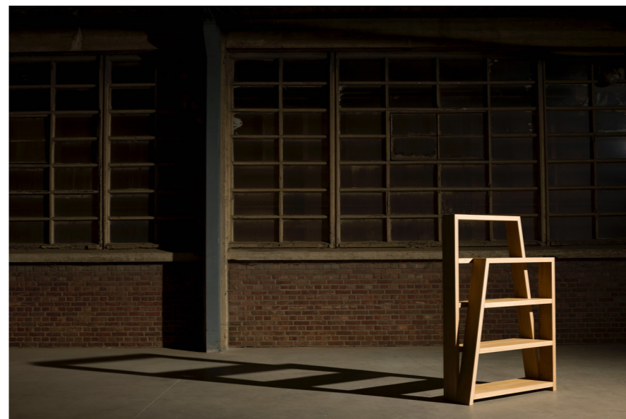
→ Folded rack De extended version van bench en rack met vier legplanken. In hoge en lage, linkse en rechtse versie verkrijgbaar. Eik L110 x B32 x H160cm Prijs op aanvraag