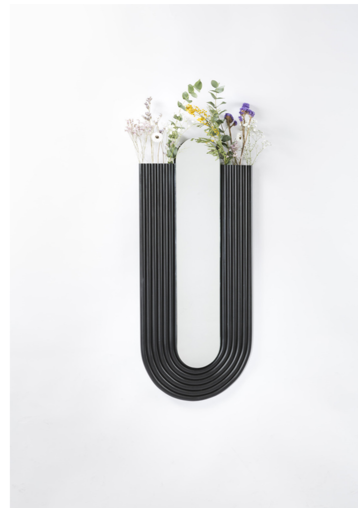
← Monade Spiegelset Aluminium Twee maten: 930cm x 420cm | 1470cm x 560cm Retailprijs: 2000€ | 2500€.