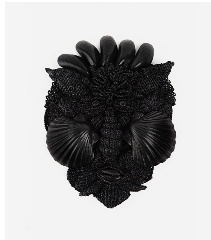
← Fatu huku Masker in raffia met schelpen bedekt met gerecycleerd leer. Raffia en leer 30cm x 25cm Retailprijs : 940€