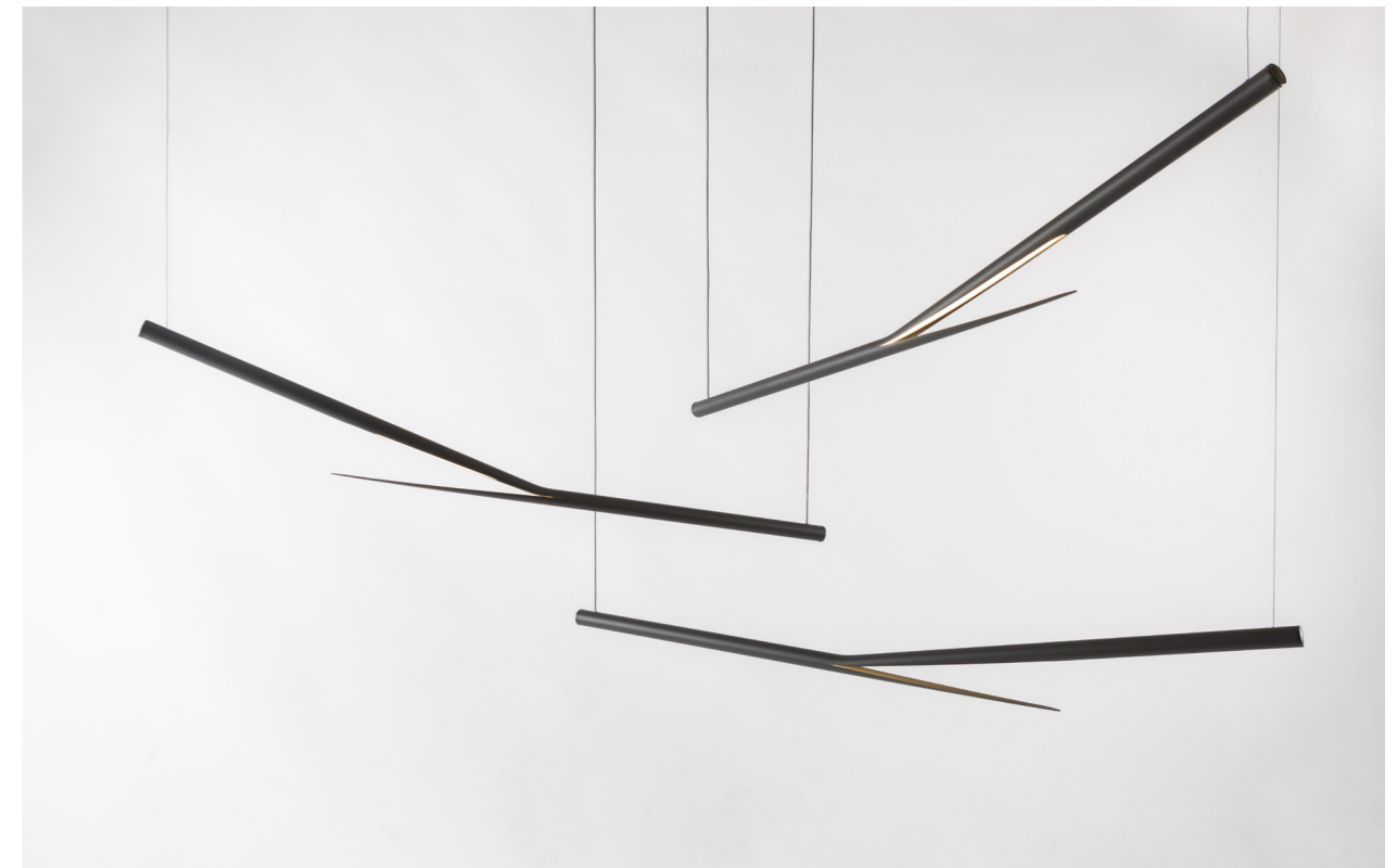
↑ Prémisse Hanglamp Aluminium en LED 1200 cm Retailprijs: 850€ (single) tot 1600€ (set)