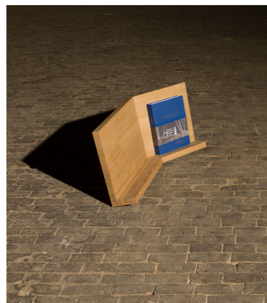
↑ Folded shelf Tijdschriften- en boekenhouder. In linkse en rechtse uitvoering. Eik L82,5 cm x B36 cm x H36cm Prijs op aanvraag